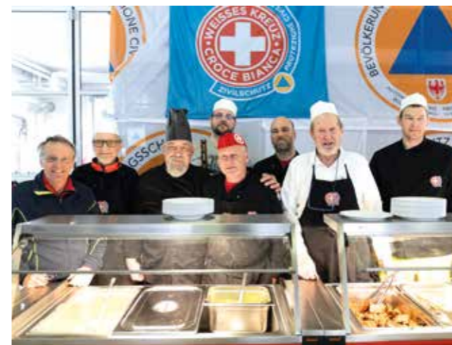
Immagine in basso: Nel basecamp della Protezione civile è stata garantita l'assistenza e l'alloggio delle forze in servizio.

Immagine a destra: A Cortina la Croce Bianca ha accompagnato i Giochi olimpici e i Giochi paralimpici.