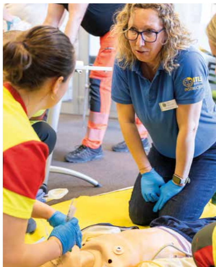
Il programma di formazione riconosciuto a livello mondiale aiuta i soccorritori a valutare correttamente le lesioni sul luogo dell'incidente e a trattarle di conseguenza.

Durante esercitazioni pratiche e realistiche, i soccorritori imparano a valutare rapidamente le lesioni sul luogo dell'intervento e a trattarle nel modo corretto, ad esempio attraverso la gestione delle vie aeree, il trattamento dello shock o l'immobilizzazione. /sr