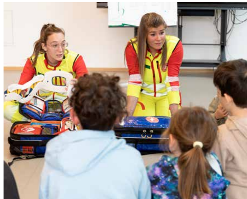
L'insegnamento del primo soccorso è stato sviluppato come progetto pilota e fa ormai parte del programma didattico in molte scuole.

Più persone in Alto Adige conoscono le basi del primo soccorso, più capillare diventa la rete di aiuto in caso di emergenza. Chi sa cosa fare può intervenire rapidamente e colmare attivamente il tempo fino all'arrivo dei soccorsi. Per questo la Croce Bianca si impegna da sempre a diffondere le conoscenze di primo soccorso sul territorio. Un importante traguardo è stato possibile proprio grazie ai fondi del 5 per mille: insieme all'autrice di libri per bambini Isabell Halbeisen, la Croce Bianca ha sviluppato un pacchetto di libri per le scuole, pedagogicamente strutturato e adatto alle diverse fasce d'età. Il materiale didattico comprende un libro di base, quaderni di lavoro individuali e un fascicolo con le soluzioni per gli insegnanti. Costituisce la base per l'insegnamento del primo soccorso nelle scuole primarie dell'Alto Adige. Il progetto, realizzato in collaborazione con le Direzioni Istruzione e Formazione tedesca e italiana, viene gradualmente esteso ad altre scuole.