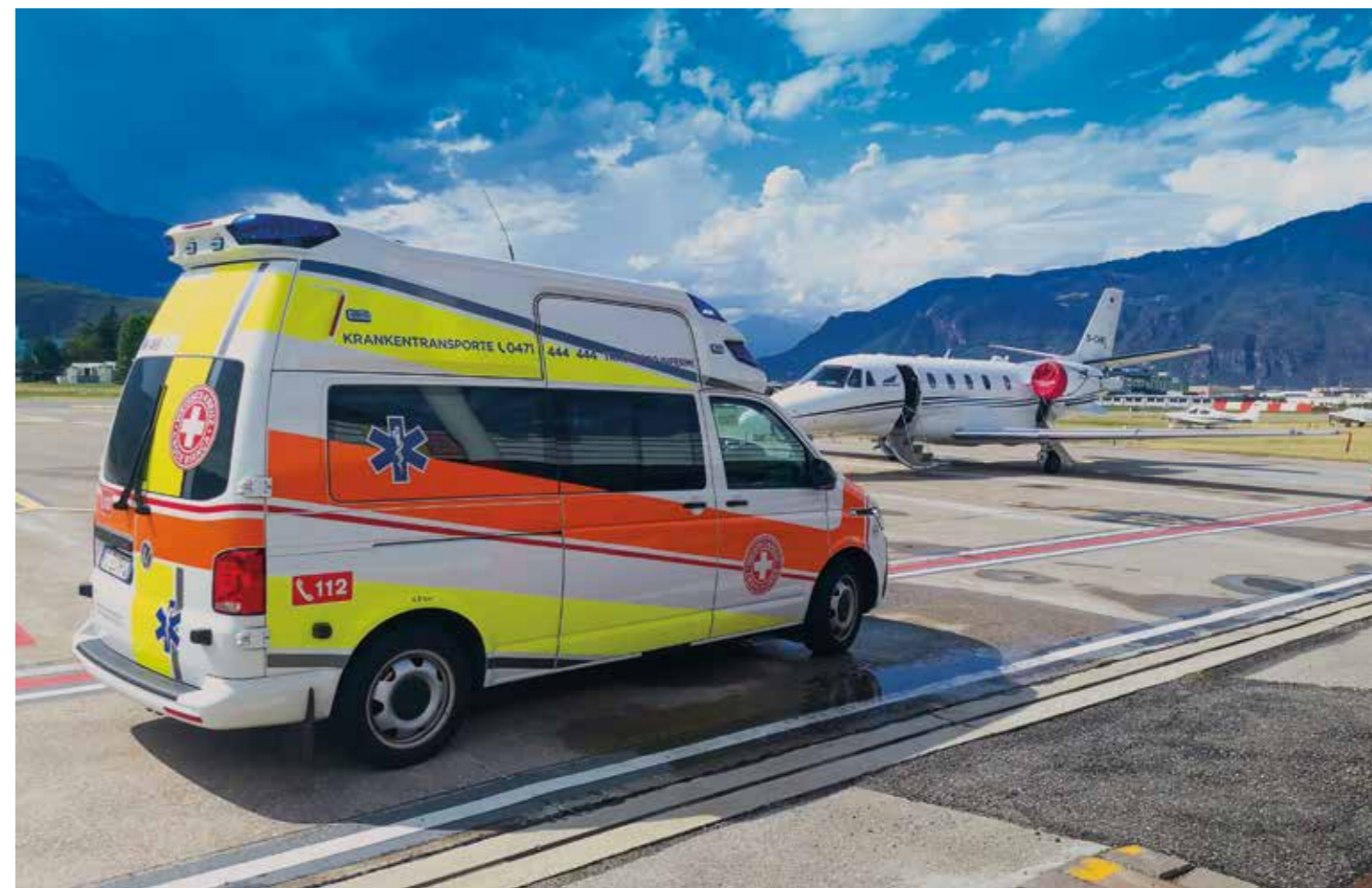
Se durante le vacanze dovessero verificarsi davvero delle lesioni o malattie, la Croce Bianca interviene immediatamente e organizza il rientro con mezzi di trasporto sicuri.