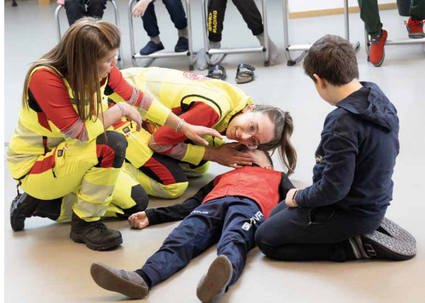
Dopo una breve introduzione teorica, i bambini e i giovani possono provare autonomamente tutte le manovre.

La parte teorica è integrata da esercitazioni pratiche: le alunne e gli alunni imparano a chiamare i soccorsi, applicare bendaggi, medicare piccole ferite o mettere una persona in posizione laterale di sicurezza. "In questo modo non solo approfondiscono le conoscenze, ma imparano anche a riconoscere situazioni di pericolo e a reagire correttamente", spiega Schmid. I contenuti più complessi vengono volutamente esclusi, per non sovraccaricare o creare insicurezza nei bambini.