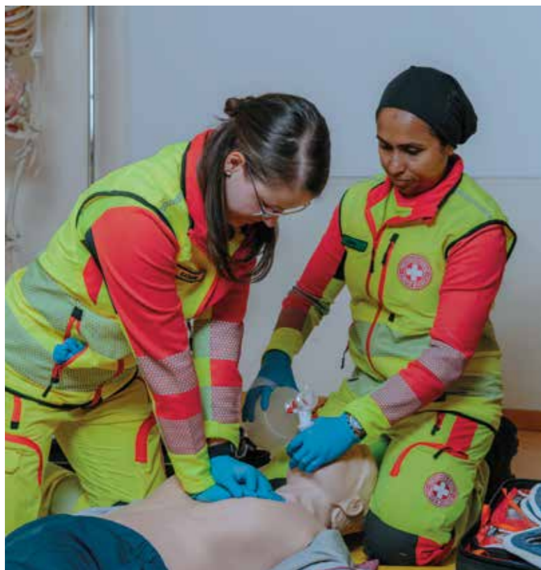
Grazie ai fondi del 5 per mille, in tutte le sezioni sono disponibili manichini di esercitazione per i volontari.