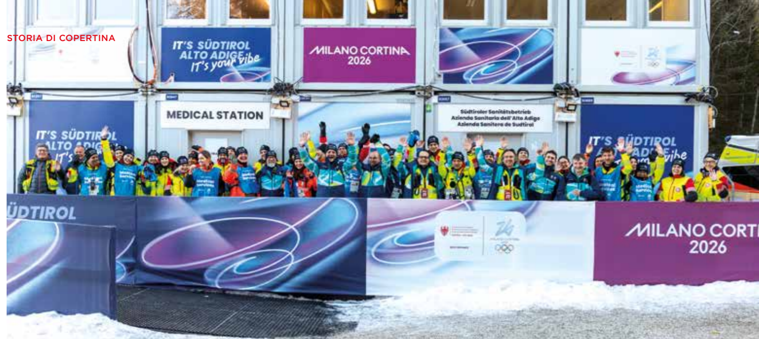
Un intervento di dimensioni straordinarie per la Croce Bianca: oltre 1.200 volontarie e volontari provenienti da tutta la provincia hanno partecipato ai Giochi olimpici con grande professionalità e impegno.