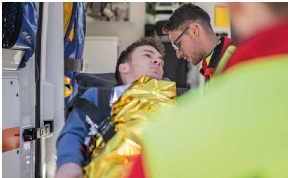
Con i monitor di emergenza, i soccorritori controllano continuamente i parametri vitali e possono reagire immediatamente a eventuali cambiamenti.

I monitor di emergenza fanno parte delle attrezzature mediche più importanti nel servizio di emergenza. Permettono di controllare continuamente i parametri vitali dei pazienti, come il ritmo cardiaco, la pressione sanguigna o la saturazione di ossigeno. Questi dispositivi sono progettati appositamente per l'uso mobile e accompagnano i pazienti dal luogo dell'intervento fino alla consegna in ospedale. In questo modo i soccorritori possono riconoscere immediatamente eventuali cambiamenti critici dello stato di salute e reagire tempestivamente. Grazie alle assegnazioni del 5 per mille, la Croce Bianca ha potuto acquistare le apparecchiature necessarie, garantendo così un'assistenza ottimale ai pazienti.