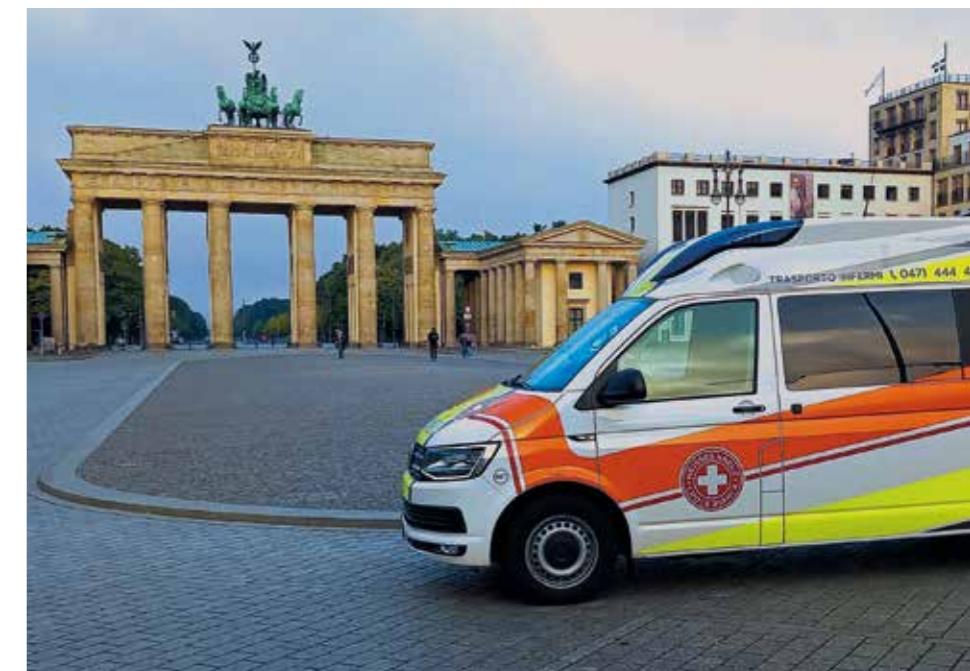
Che si tratti di Parigi o Berlino, dell'Asia o dell'America: la copertura garantita dall'adesione "Weltweit+" della Croce Bianca è valida ovunque.