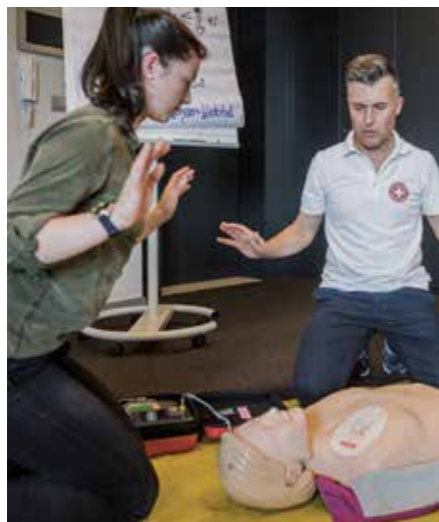
L'uso del DAE aumenta significativamente le possibilità di sopravvivenza in caso di arresto cardiocircolatorio.

Con le assegnazioni del 5 per mille, la popolazione dell'Alto Adige sostiene importanti progetti della Croce Bianca. I fondi confluiscono direttamente in attrezzature moderne, formazione e iniziative che, in caso di emergenza, possono fare la differenza - a beneficio di tutte le persone del territorio.