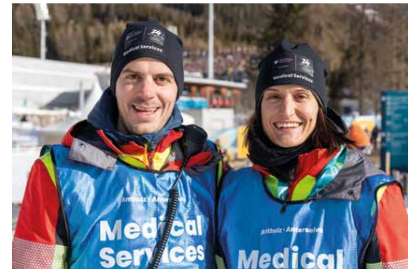
Nel vivo dell'azione: i volontari impegnati nel servizio sanitario lungo la pista di gara ad Anterselva.

Immagine a destra: A Cortina la Croce Bianca ha accompagnato i Giochi olimpici e i Giochi paralimpici.